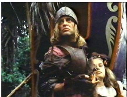
LOPE DE AGUIRRE

Son los personajes secundarios los que verdaderamente se apartan de la moral establecida: Lope de Aguirre, Zaldumbide, Juan Machín y Sir Wilkins.